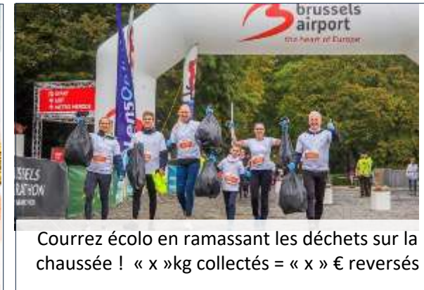
Courrez écolo en ramassant les déchets sur la chaussée ! « x » kg collectés = « x » € reversés