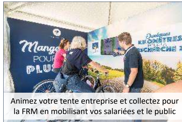
Animez votre tente entreprise et collectez pour la FRM en mobilisant vos salariées et le public

La Loi de Finances 2020 permet également aux petites et moyennes entreprises (PME) réalisant moins de 2 millions d'euros de chiffre d'affaires de bénéficier d'une réduction fiscale à hauteur de 60 % de leur don dans la limite de 20 000 €.