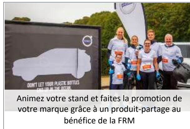
Animez votre stand et faites la promotion de votre marque grâce à un produit-partage au bénéfice de la FRM